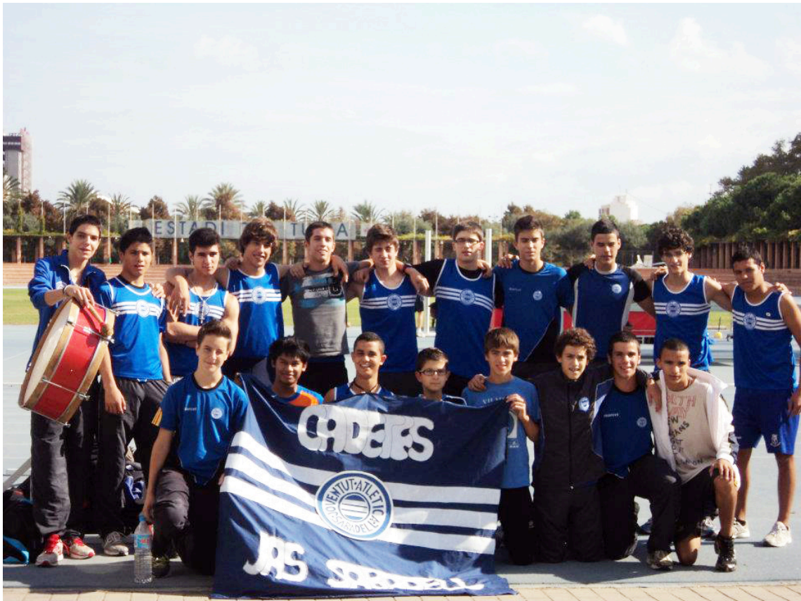
Crònica d'Aitor Rodríguez