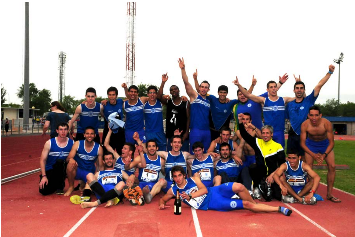
Equip masculí que va aconseguir l'ascens a Divisió d'Honor (Alcorcón 2-06-2012)

Les categories absolut i cadet masculí, i la conjunta, és la millor dels darrers 20 anys.