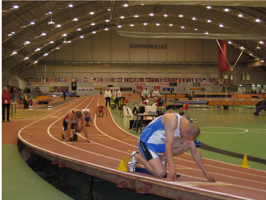
Hippos Hall. Sortida d'una cursa de 200 metres (peralt al màxim i sense barana)

Una de les novetats de la competició fou que els tres de sortida eren fets mitjançant pistola elèctrica, això provocava un estalvi considerable de