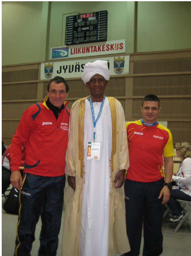
Grup d'atletes espanyols amb el representant de la IAAF : Mustafa El Abbadi (Sudan).