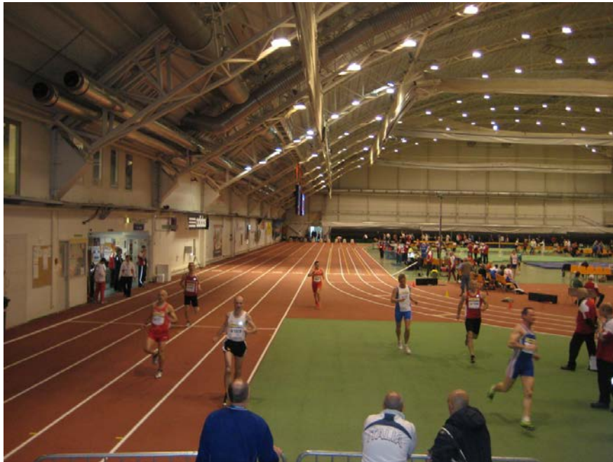
Hippo Hall. Arribada d'una cursa de 60 metres (recta annexa lateral)

Mentre que la cambra de requeriments (call rom) era tan petita que no cabien suficients cadires per seure tots els atletes (els últims en arribar havien d'estar drets). Malgrat aquestos inconvenients, Jyvaskyla fou escollida seu en l'Assemblea de la WMA (World Master Athletics) en el transcurs del mundial fet a Lahti, FIN (2009) al ser l'única candidatura presentada.