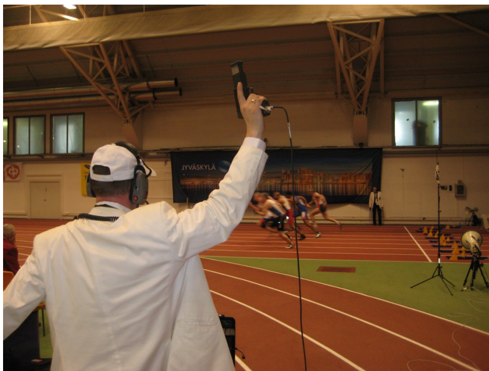
Hippos Hall. Sortida d'una cursa de 60 metres (recta annexa lateral)

La ciutat finlandesa de Jyvaskyla va acollir el 5è Campionat del Món de veterans de pista coberta (3/8 abril). Sindelfingen, GER (2004), Linz, AUT (2006), Clermont-Ferrand, FRA (2008) Kamloops, CAN (2010), han estat les seus precedents. Ciutat de 132.000 habitants, es troba a quasi 300 kilòmetres al nord de la capital, Helsinki. Té els drets com a ciutat des de l'any 1837, és a dir, just fa 175 anys.