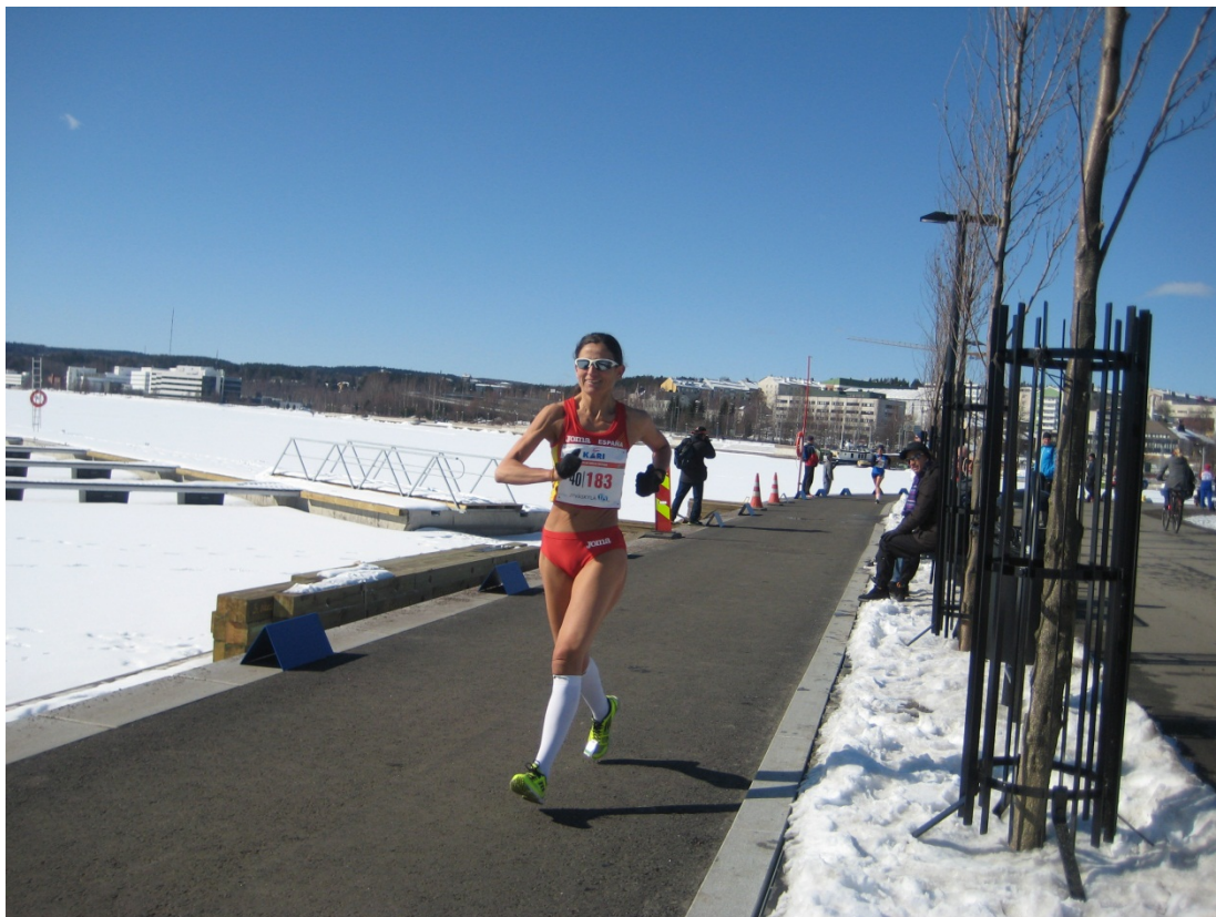
Port. Prova de marxa en ruta al voltant del llac gelat (mateix escenari per la mitja maratón)

Un altre de les coses que hem va sorprendre (de fet, ho veig observant en tots els campionats) es la implicació de certes seleccions a l'hora de presentar un equip de relleus. Enguany hem va sorprendre Finlàndia (l'equip amfitrió), presentant un equip a cada categoria des de M-85 (els homes) i des de W-75 (les dones). Un cop a pòdium (van assolir varies medalles): els 4 components lluint amb orgull la seva samarreta de "Suomi" (Finlàndia en finés), cantant l'himne, així com el públic local (dret). Això ho vaig comprovar "in situ", doncs vaig atrevir-me (i no ho digueu a ningú) a voler canviar la meua samarreta nacional per una d'un atleta finlandès. Sota el seu xandall (evidentment del país) dedueixo que llueix la seva samarreta... i després d'una petita conversa de cortesia li demano l'intercanvi. Accepta però pactem el lliurament després de la cerimònia protocol·lària de les curses de relleus (no s'acabava mai...)... ja que al ser atleta premiat no volia pujar a pòdium sense la seva samarreta ¡¡¡