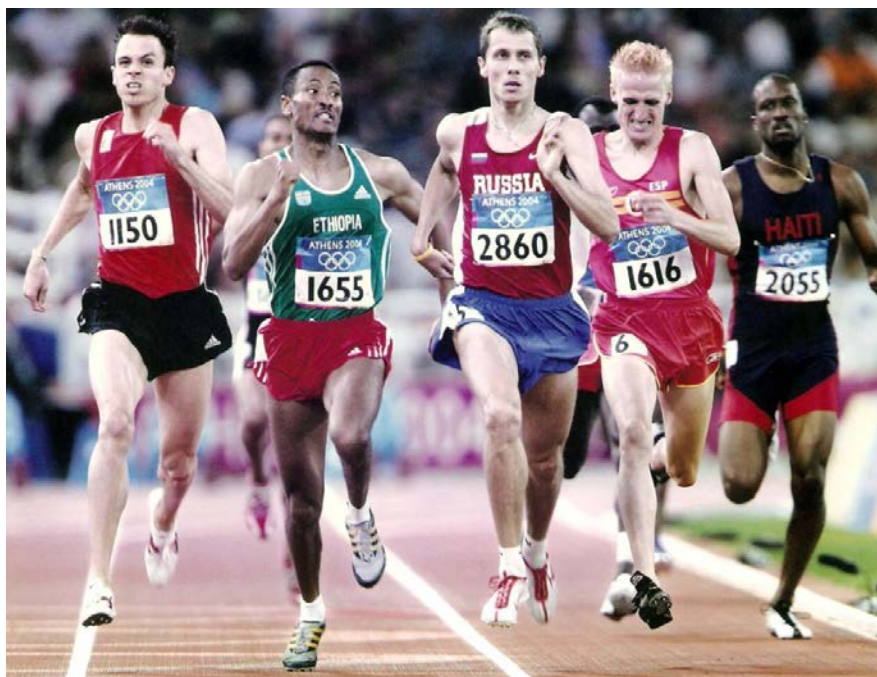
Semifinal 800 m.ll. (Atenes 2004)

Al haver 9 series només es repescaven els 6 millors temps per completar les semifinals. Per cert, en la sèrie d'en Miquel, el guanyador fou el rus Yuriy Borzakovski, posteriorment, campió olímpic.